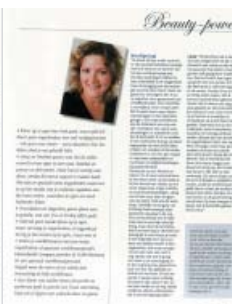
RTV Utrecht op bezoek bij workshop