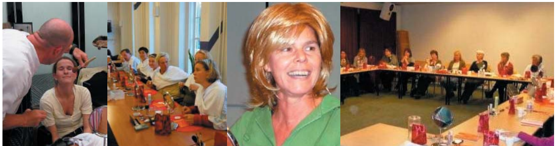
Grote opkomst en enthousiasme bij de verpleegkundigen bij start workshops in ziekenhuizen