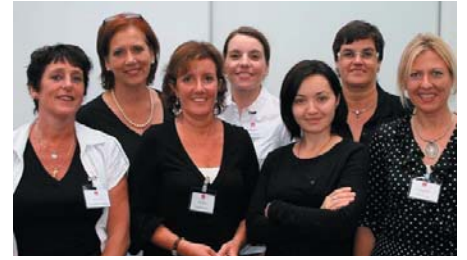
Team OLVG Amsterdam

Workshops 2008: van 23 naar 36 ziekenhuizen Eind 2007 vonden in 23 ziekenhuizen workshops Goed Verzorgd, Beter Gevoel plaats. Nu, eind 2008, is dit aantal uitgebreid tot 36 ziekenhuizen. Ook patiënten van de ziekenhuizen in o.a. Hilversum, Blaricum, Oss/Veghel, Tilburg en Nijmegen kunnen vanaf nu gratis deelnemen aan de workshops uiterlijke verzorging voor mensen met kanker. Op onze website www.goedverzorgdbetergevoel.nl kunt u vinden waar en wanneer de workshops worden gehouden.