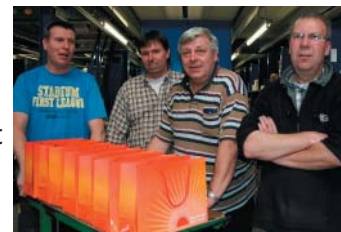
Een aantal leden van team Maarleveld

Maarleveld & Co is sinds 2006 verantwoordelijk voor de distributie van de tasjes die worden uitgedeeld bij de workshops van Goed Verzorgd, Beter Gevoel. De tasjes zijn gevuld met achttien verschillende cosmeticaproducten. Het aantal workshops van Goed Verzorgd, Beter Gevoel is inmiddels gegroeid tot gemiddeld zo'n twintig per maand in diverse ziekenhuizen in het hele land en zal nog verder groeien.