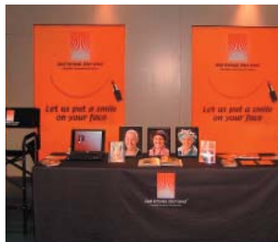
Vernieuwde stand Goed Verzorgd, Beter Gevoel goed bezocht

bezoeken. Goed Verzorgd, Beter Gevoel was met een (vernieuwde) stand aanwezig waar men informatie kon krijgen. Mede dankzij Bransus en L'Oréal hebben ook veel bezoekers kunnen ervaren dat goed verzorgd, een beter gevoel geeft!